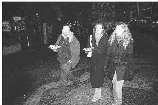
Einsatz auf der Strasse

(Beispiel: Atheismusdebatte). Einige der Gemeinden wünschen sich, wie die Umfrage gezeigt hat, auch wieder einmal eine Vortragswoche mit einem Evangelisten. Uns als Allianzvorstand liegt viel daran, solche Initiativen zu fördern. Selber haben wir nur begrenzt Ressourcen, solche Projekte umzusetzen. Unser Anliegen ist aber, dass wir Gemeinden und Werke mit ähnlichen Anliegen vernetzen können, um so gemeinsam ein Zeugnis ablegen zu können.