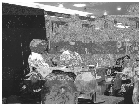
Atheismusdebatte in der Buchhandlung Thalia