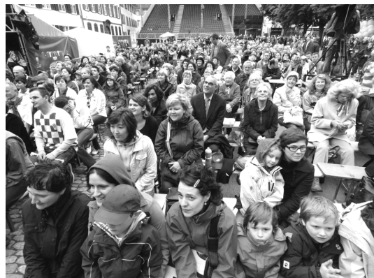
Gottesdienst auf dem Münsterplatz